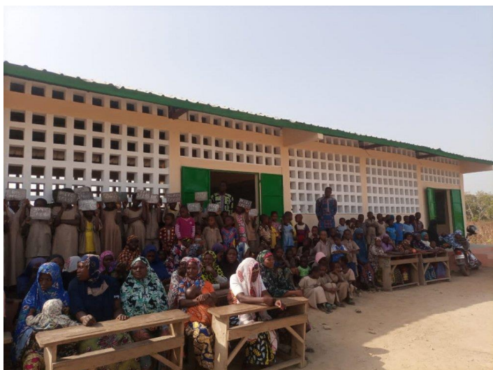
Inauguration du primaire de Naworo

Ils ont eu l'inauguration en décembre 2022. Quelle joie pour tout le monde concerné.