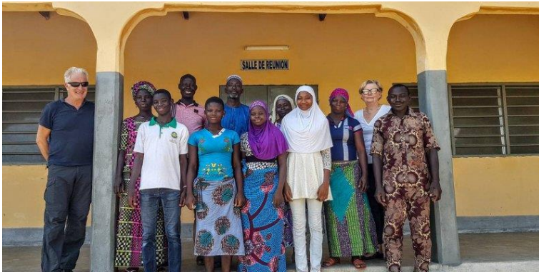
Quelques boursiers avec leurs parents

Nous allons continuer avec nos 6 boursiers. Il y a un roulement de 2 élèves chaque année au Lycée. Nous commençons à profiter de ce projet car nous avons déjà un instituteur, une coiffeuse et des étudiantes à l'université !!! Bientôt peut-être une sage-femme, un médecin et une infirmière !