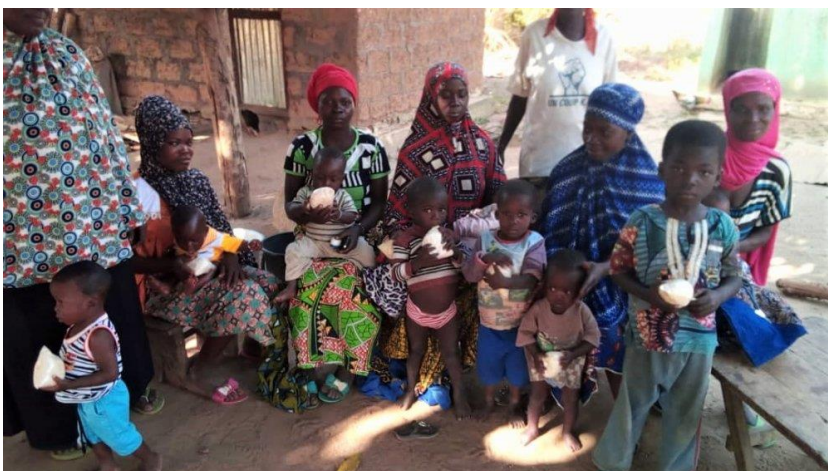
Association des Femmes

Il y a un problème dans le village de jeunes enfants sous-alimentés et ils ont donc commencé à travailler sur un projet de création de packs de nourriture, à base de céréales mais avec des vitamines ajoutées. Ils sont aidés dans ce projet par l'infirmière du dispensaire local. Comme vous pouvez le voir sur les photos le projet avance de manière positive.