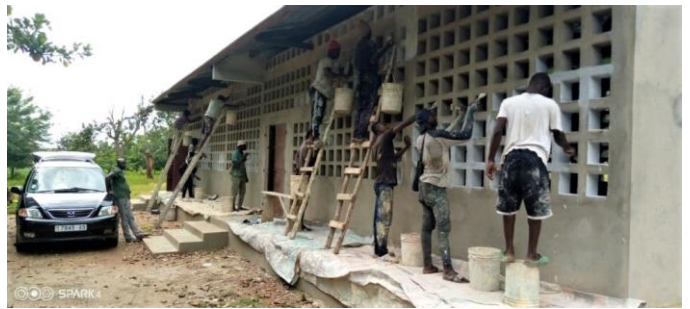
Finition du bâtiment