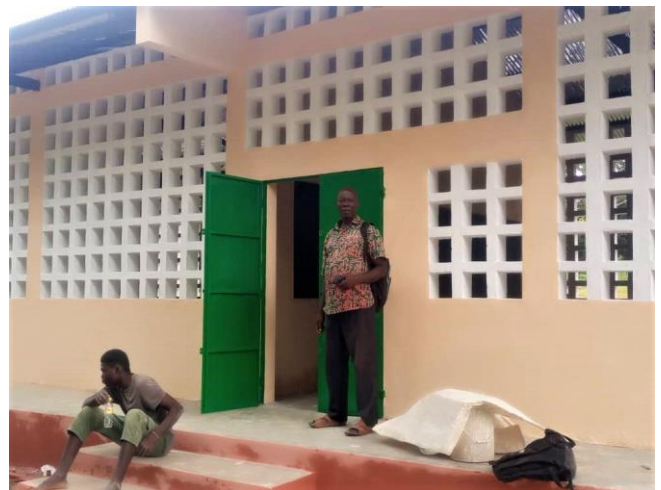
Le bâtiment fini