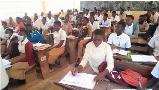
Une nouvelle classe