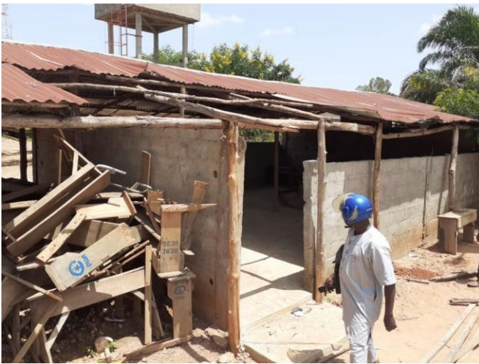
Baraque en tôle détruite par la tempête

Ce lycée qui héberge 600 élèves, compte aujourd'hui deux bâtiments en dur de trois et deux classes et trois classes toujours hébergées sous des baraques en tôle. Ce lycée est de plus en plus fréquenté par les collégiens de Sagbadaï