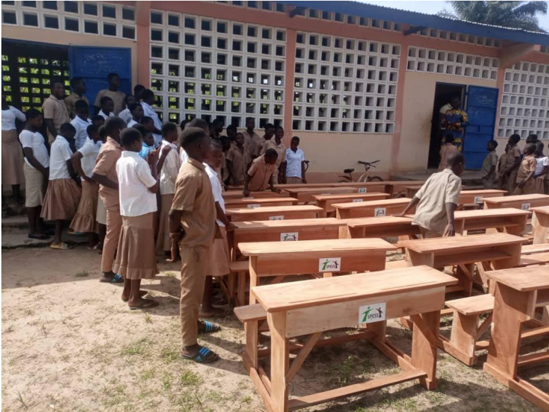
Les 25 nouveaux tables-bancs pour le collège du Sagbaï

Projet "imprévu" : en raison d'un nombre record de collégiens à Sagbadai lors de la dernière rentrée scolaire, il a fallu assurer en urgence la fourniture de tables et de bancs pour asseoir dignement tout le monde. La fabrication de 25 tables-bancs (pour 50 élèves) a été confiée à nos amis de la menuiserie Tchedré de Sokodé, et livrée dans un temps record. Il a fallu bien sûr adapter les priorités budgétaires et repousser à plus tard les travaux d'améliorations moins urgents prévus au budget pour l'école primaire de Sagbadai.